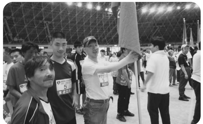
7月 スポーツカーニバル