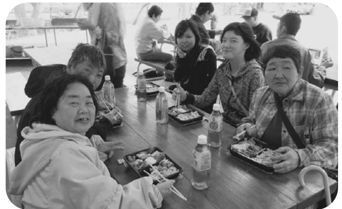
4月 ちょっとお出かけ 醒井養鱒場